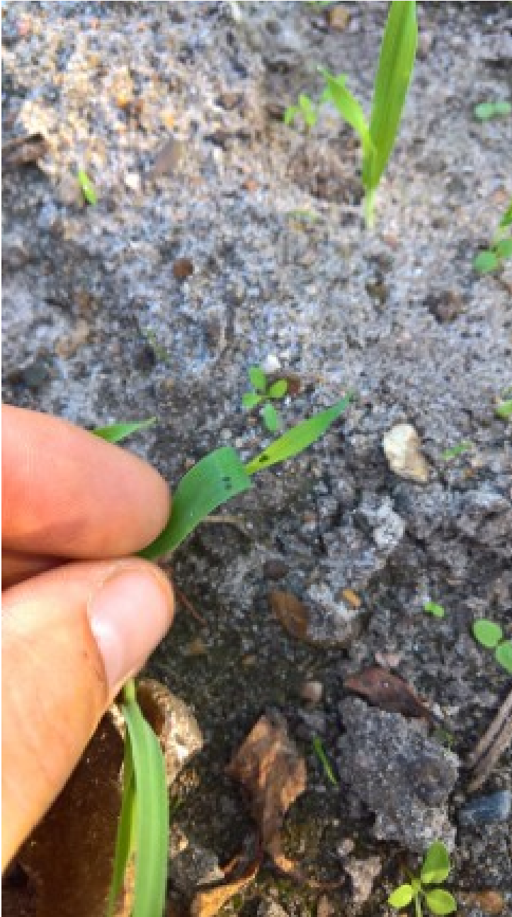
Billede 2. Bladlus i vinterbyg sået 2. september. Fotograferet 15. september af Mads Brandt, Landbrugsrådgivning Syd.

Kontakt din lokale rådgivningsvirksomhed , hvis du vil vide mere om dette emne.